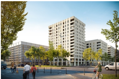
Abbildung 1: Ansicht aus Nordosten von der Engstringerstrasse (Visualisierung)

https://owncloud.geistlich.ch/index.php/s/gZ667zd4KLnqkyq