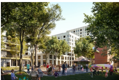
Abbildung 2: Sicht von Südwesten aus dem Rietpark (Visualisierung)